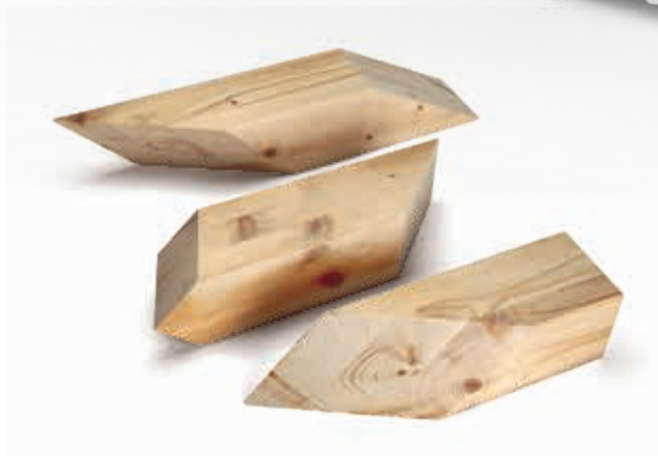
Exemple de coupe spéciale